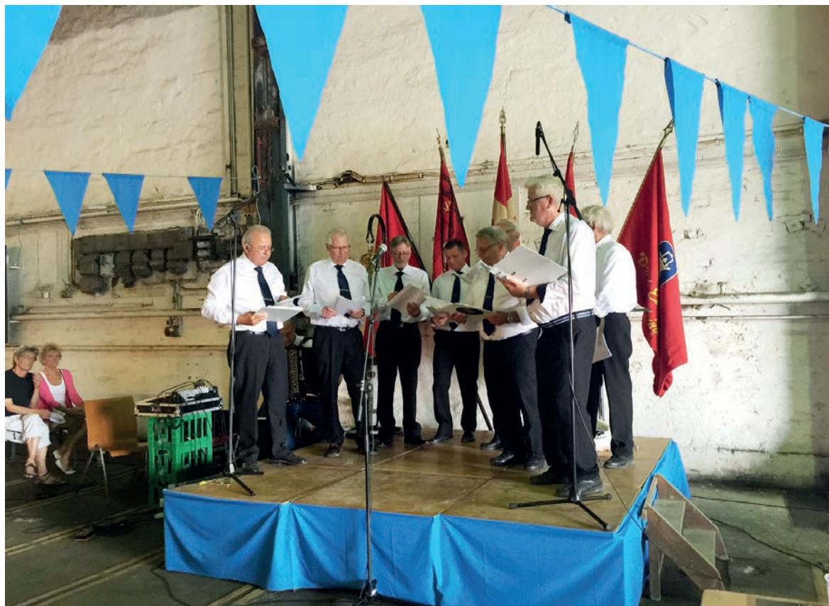
Smedekoret Tubal Kain sang for til fællessang på Værftstræffet 2016.

Grundlovsdag. Foråret bød traditionen tro også på en ikke-politisk festligholdelse af Grundlovsdag. Endnu en gang blev dagen fejret i de smukke omgivelser ved Flynderupgård