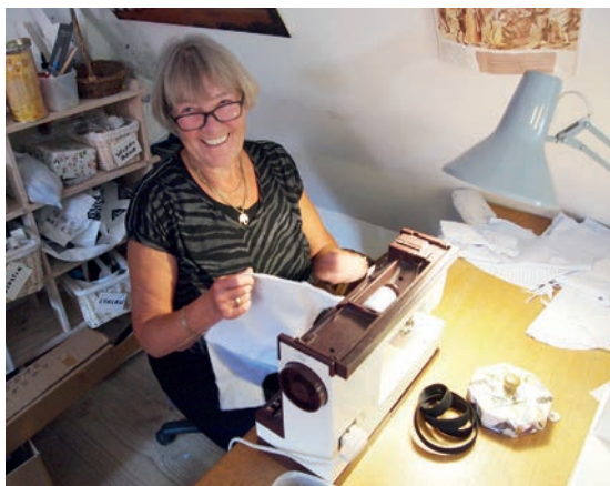
Systuen på Museet Skibsklarerergaarden summer af liv året igennem. Her sys de historiske dragter til Sundtoldsmarkedet.

Sypigerne står for fremstillingen af de historiske dragter, der bruges på markedet. Museet råder i dag over 400 dragter, der alle er produceret af sypigerne. Et mål for gruppen, der er meget ambitiøse, er at der arbejdes så tæt på historiske forlæg som muligt. I 2016 fik den frivillige leder af sypigerne mulighed for at deltage i uddannelse indenfor historisk syteknik, mønstertegning og tilskæring.