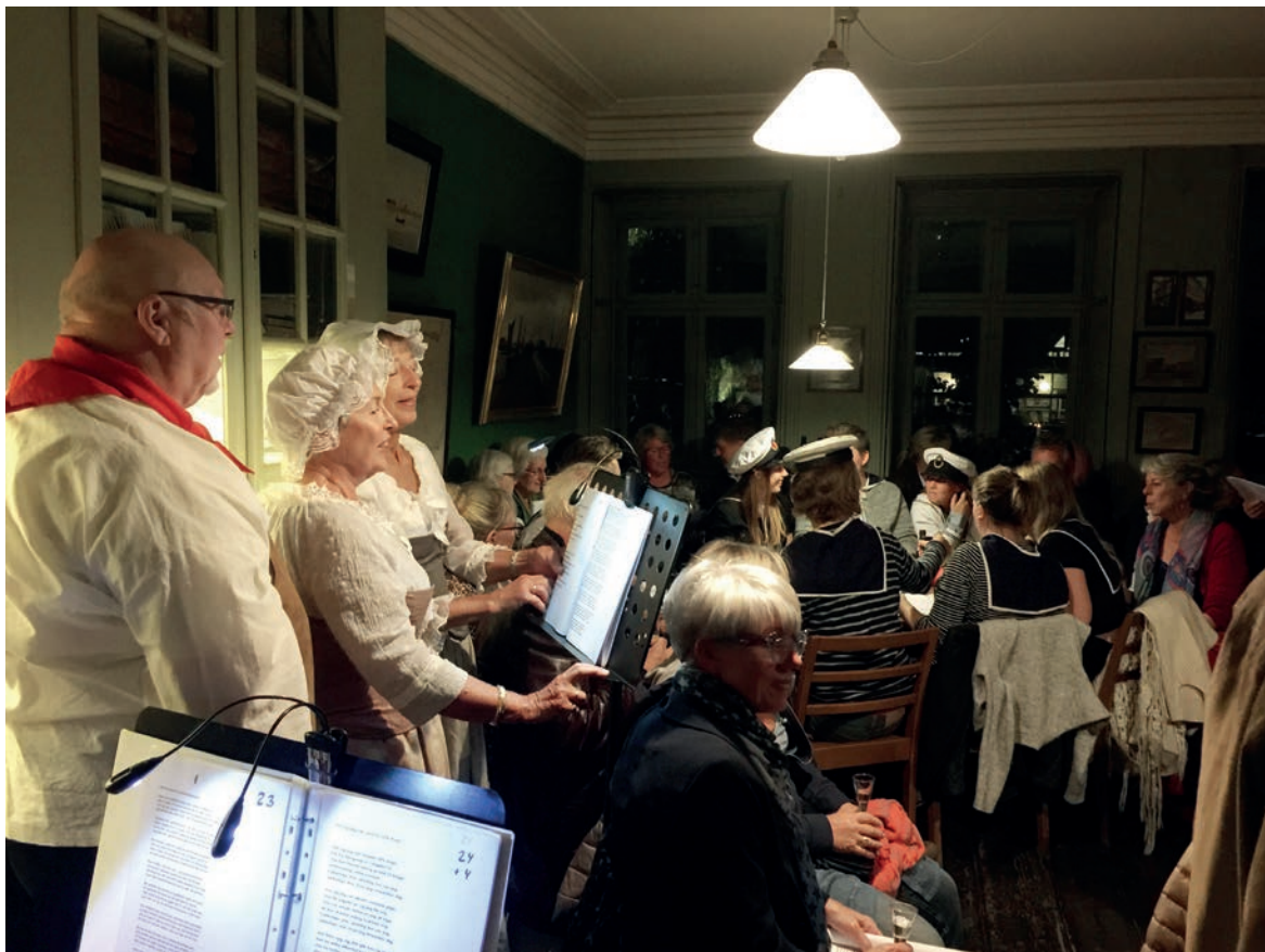
Museet Skibsklarerergaarden var godt besøgt under knejpefestivalen. Hvor der var fællesang og sømandsstemning i Skipperstuen.