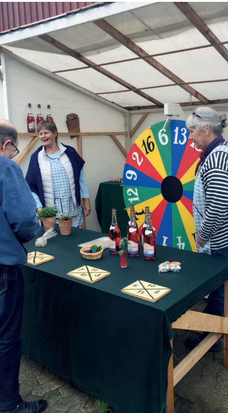
Populær ved årets høstfest og marked på Flynderupgård var lykkehjulet, som frivillige i museets tømrerværksted havde fremstillet i løbet af sommeren.

Sundtoldsmarkedet Skibsklarerergaarden, havnepladsen ved Strandgade og Kongekajen dannede den 18.-19. august rammen om Sundtoldsmarkedet. Lørdag besøgte 14.000 gæster det historiske marked, der med boder og markedsliv formidler en handelsplads som den kunne have set ud i 1800-tallets Helsingør. Årets marked havde 50 historiske boder, historiske sejlskibe, markedsgøgl, åbne historiske gårde, byvandring, guidede omvisninger i kirkerne og udstilling på biblioteket. Fredagen var allokateret til formidling på markedet for skoler og børnehaver. Fredag aften var der historisk Sundtoldsmiddag i Odd Fellow Logens lokaler, der arrangeredes i samarbejde med Copenhagen Cooking.