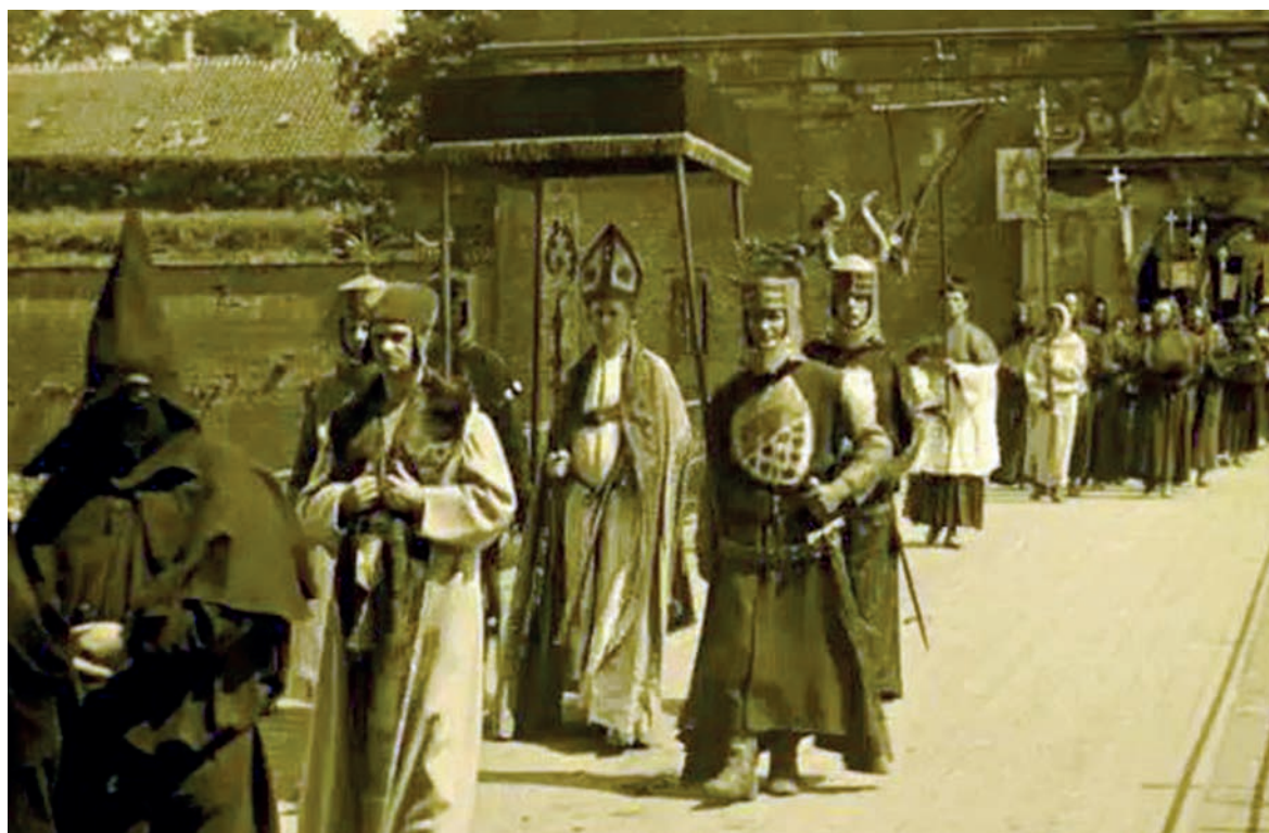
Helsingør fejrede i 1926 købstadens 500-års jubilæum. Et af jubilæets folkelige højdepunkter var det historiske optog, der gik fra Kronborg gennem Helsingør. Hvad fortæller det om byens identitet? Det undersøges i forskningsprojektet »Sundtoldsby, søkøbstad eller værftsby«.